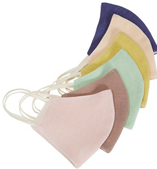
キュアテックス（和紙糸）x 艶金（のこり染）の「和紙のやさしさマスク」