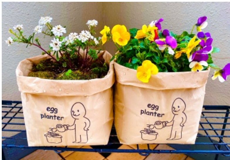
ネクアスの卵殻51%配合フィルムプランター