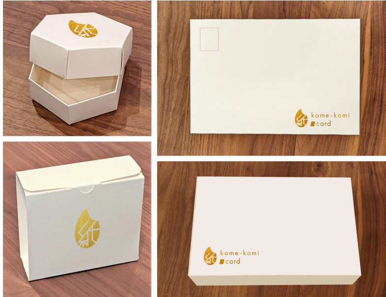
ペーパルの非食米で作った紙製品「kome-kami」